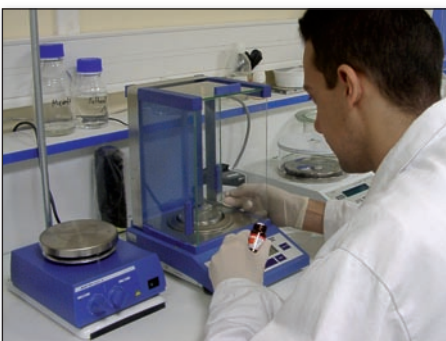
Préparation d'échantillons biologiques.

présentes dans un échantillon, on estime qu'en fait, on analyse seulement 10 % du matériel existant. C'est un terrain fertile pour engager de nouveaux concepts avec des approches innovantes à fort potentiel de valorisation et nous sommes convaincus que les micro et nanotechnologies peuvent faire avancer la protéomique et lever des verrous (pré)-analytiques de façon à être plus exhaustif dans l'analyse du protéome global. Grâce aux compétences capitalisées à FEMTO-ST dans la miniaturisation, les microdispositifs et les microsystèmes type bio-puce \mu arrays, microfluidique et laboratoires sur puce, notre objectif est clairement de devenir la première plateforme d'innovations technologiques au service de la protéomique clinique directement dans les CHU". C'est aussi d'optimiser les étapes de prétraitement et d'analyse des échantillons biologiques et de mettre au point des outils pour le diagnostic de pathologies humaines et le criblage de molécules médicamenteuses. ■